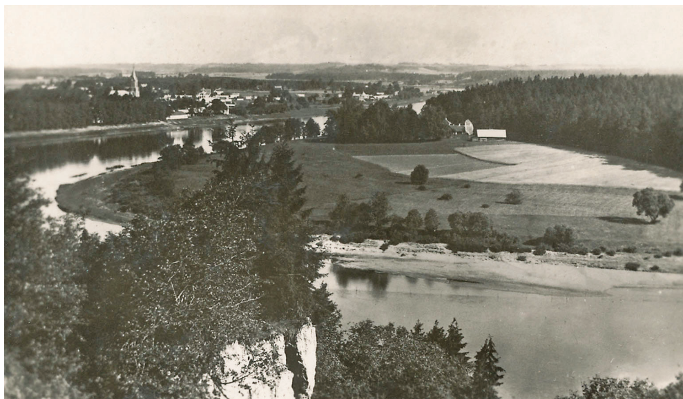
3 pav. Birštono vaizdas tarpukariu. Dešinėje Nemuno pusėje – Alkniakiemio teritorija.

Birštono kurortą valdantis Raudonasis Kryžius tapo vienas pirmųjų, pasinaudojusių gautomis teisėmis. Visos iš kurorto eksploatacijos gautos lėšos buvo investuojamos į modernizavimą ir plėtrą 41 . Svarbi