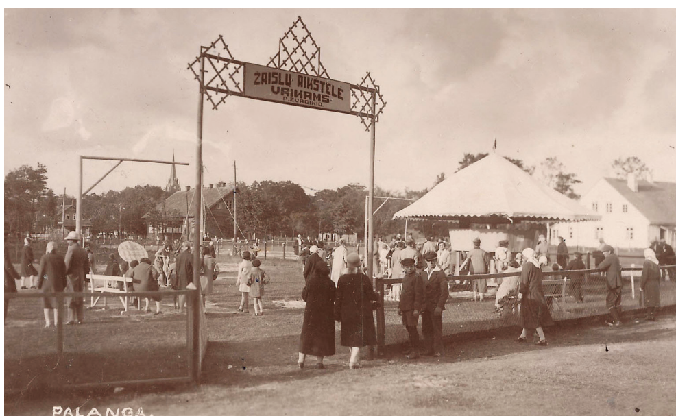
6 pav. Vaikų žaidimų aikštė Palangoje tarpukariu. Atvirutė iš Petro Kaminsko asmeninio rinkinio

Didžiausi miestovaizdžio pokyčiai kurorte vyko nuo 1933–1934 iki 1938 m.: „statant naujus statinius“ 65 buvo laikomasi statybos įstatymų, <...> įkurtas miesto parkas [inž. V. Rimgaila], kuriame pastatyta estrada, vaikų žaidimo aikštelė 66 ir kt. (6 pav.). 1937 m. suburta nauja kurorto administracija (jos