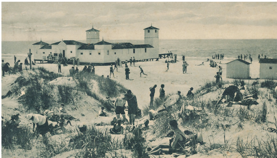
8 pav. Palanga, bendros maudyklės tarpukariu. Atvirutė iš Petro Kaminsko asmeninio rinkinio

įvairioms tarpukario organizacijoms (Mokytojų sąjungai, Policijos sporto klubui, Lietuvos karo invalidų sąjungai ir kt.; 7 pav.), steigti privačius gydymo kabinetus 72 . Šiltųjų maudyklių pastate buvo atliekamos pašildinto jūros vandens, mineralinės ir gydomųjų žolių vonios bei įvairios gydymo procedūros; sezono metu papildomos vonios veikė ir Palangos progimnazijos patalpose 73 : „Palangoje gydymas tikrai modernišką. Pirma į gydyklas, o tik paskui į kopas ir jūrą! Vasarotojai sekmadienius atpažįsta iš antplūdžio. Tiktai ne jūros vandens antplūdžio, bet sekmadieniais atvykstančios publikos. Ir ne tiek