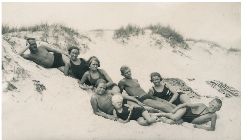
9 pav. Palangos pajūryje tarpukariu. Atvirutė iš Vytauto Sinkevičiaus asmeninio rinkinio

pliaže ir kopose, kiek įvairiose Palangos gydyklose ir sanatorijose 74 (8, 9 pav.).