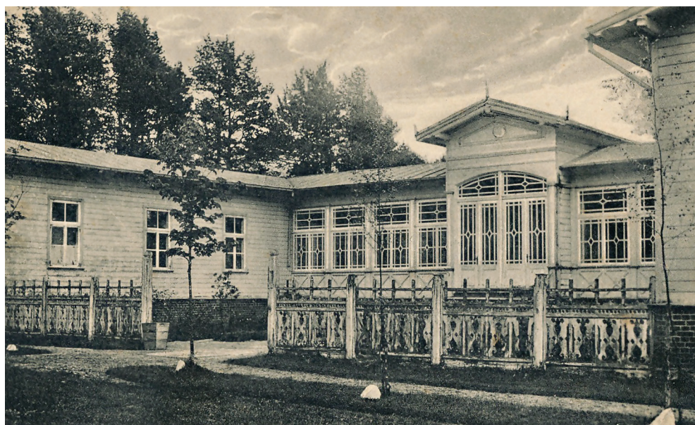
2 pav. Šiltųjų vonių pastatas Palangoje tarpukariu.

Palangos atkūrimo diskurse nebuvo aplenktas ir sveikatinimo klausimas, tačiau šis aspektas artimesnis labiau profilaktinės („saulės vonių“) medicinos kryptčiai nei orientuotas į sunkių susirgimų gydymą: „šis kurortas tinka skrupulu sergantiems vaikams. Sergą limpamomis ligomis ir tuberkuloze neįsileidžiami“ 33 . Poilsio veiklų įvairovė Palangoje papildyta integruojant profilaktinę mediciną. Šiam tikslui suformuotas poreikis atstatyti vienintelį